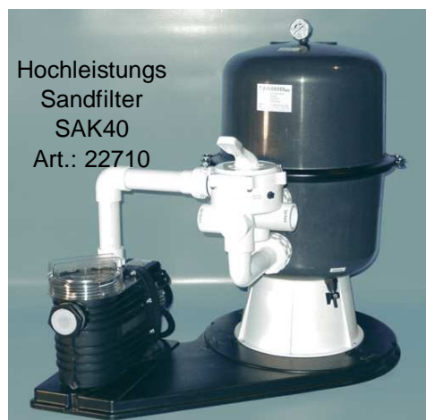
Hochleistungs Sandfilter SAK40 Art.: 22710